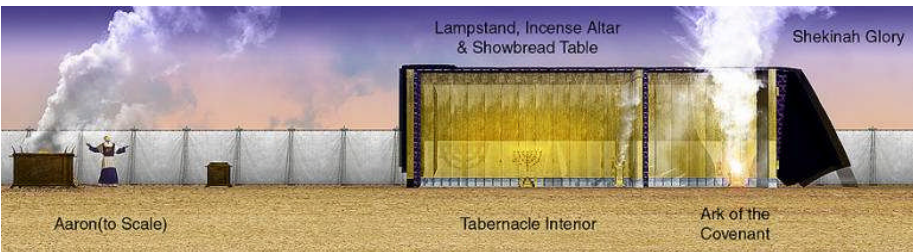
EL TABERNACULO EN EL DESIERTO

Un velo separaba al hombre de la presencia de Dios que estaba en el Lugar Santísimo He 9:3, solo por la sangre se permitía entrar.