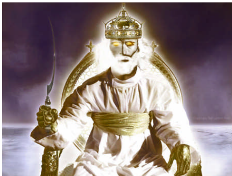
JESUS CON LA HOZ AGUDA PARA SEGAR LA TIERRA (Ap 14:14-16)