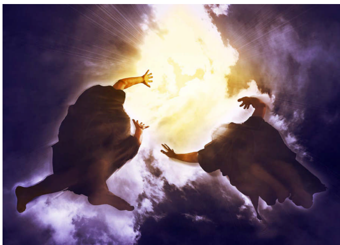
LOS DOS TESTIGOS SON TOMADOS AL CIELO

HASTA QUE SE DERRAMEN LAS SIETE COPAS (Ap 15:8)